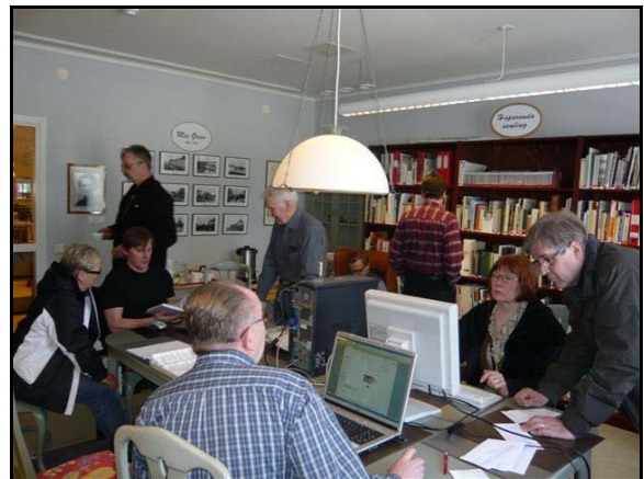
Öppet Hus Haparanda Stadsbiblioteket

Tiedot yhdistyksen toiminnasta on nyt helposti löydettävissä osoitteessa: www.htgenealogia.org