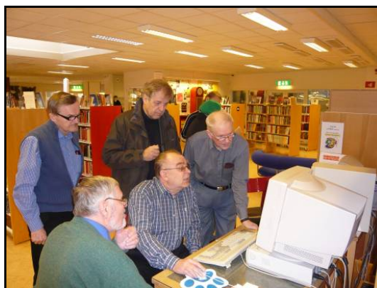
Öppet Hus Haparanda Stadsbiblioteket